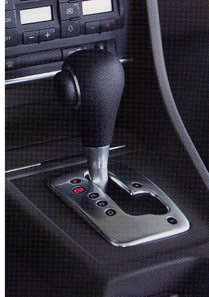
Schattknüppel der Audi-Schaltautomatik. Die metallische Optik beruht auf der Direktmetallisierung.

Die Aktivierung erfolgt jedoch nicht wie bei den konventionellen Verfahren mit Hilfe von Kolloiden, das Aktivormetall wird vielmehr in einem Komplex aus Aminliganden, beispielsweise Ammoniak, eingebunden. Als Aktivierungsmetalle kommen Mangan, Eisen, Kobalt und Nickel in Frage. Beim Aktivierungsprozess lösen sich dann die Aktivormoleküle von den Liganden und verbinden sich mit den in der Beize gebildeten Alkohol- und Carbonylgruppen der Kunststoffoberfläche. Nach der Aktivierung folgt der Spülschritt, bei dem die lose anhaftenden Aktivorkomplexe von der Gesteisolation gelöst werden. Im dritten und letzten Schritt wird die Aktivorschicht nochmals durch eine Leitlösung mit dem Substrat vernetzt und damit die Haftfestigkeit weiter verbessert. Auf die so vorbehandelte Oberfläche muss zur Zeit als erste Schicht eine Nickelschicht abgeschieden werden. Anschließend folgt die eigentliche Galvanisierung.